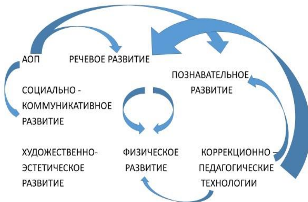
СХЕМА. ИНТЕГРАЦИИ ОБРАЗОВАТЕЛЬНЫХ ОБЛАСТЕЙ В ГРУППЕ КОМБИНИРОВАННОЙ НАПРАВЛЕННОСТИ

Образовательная деятельность в группе комбинированной направленности для детей с ТНР